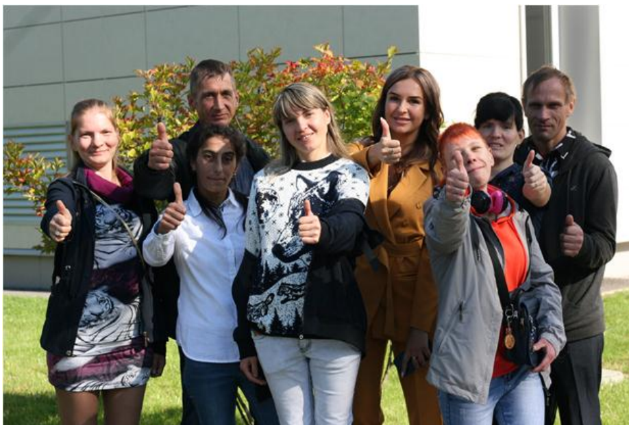
Рисунок 2. выпускники Мультицентра, участники проекта "Три шага на пути к самостоятельному проживанию"